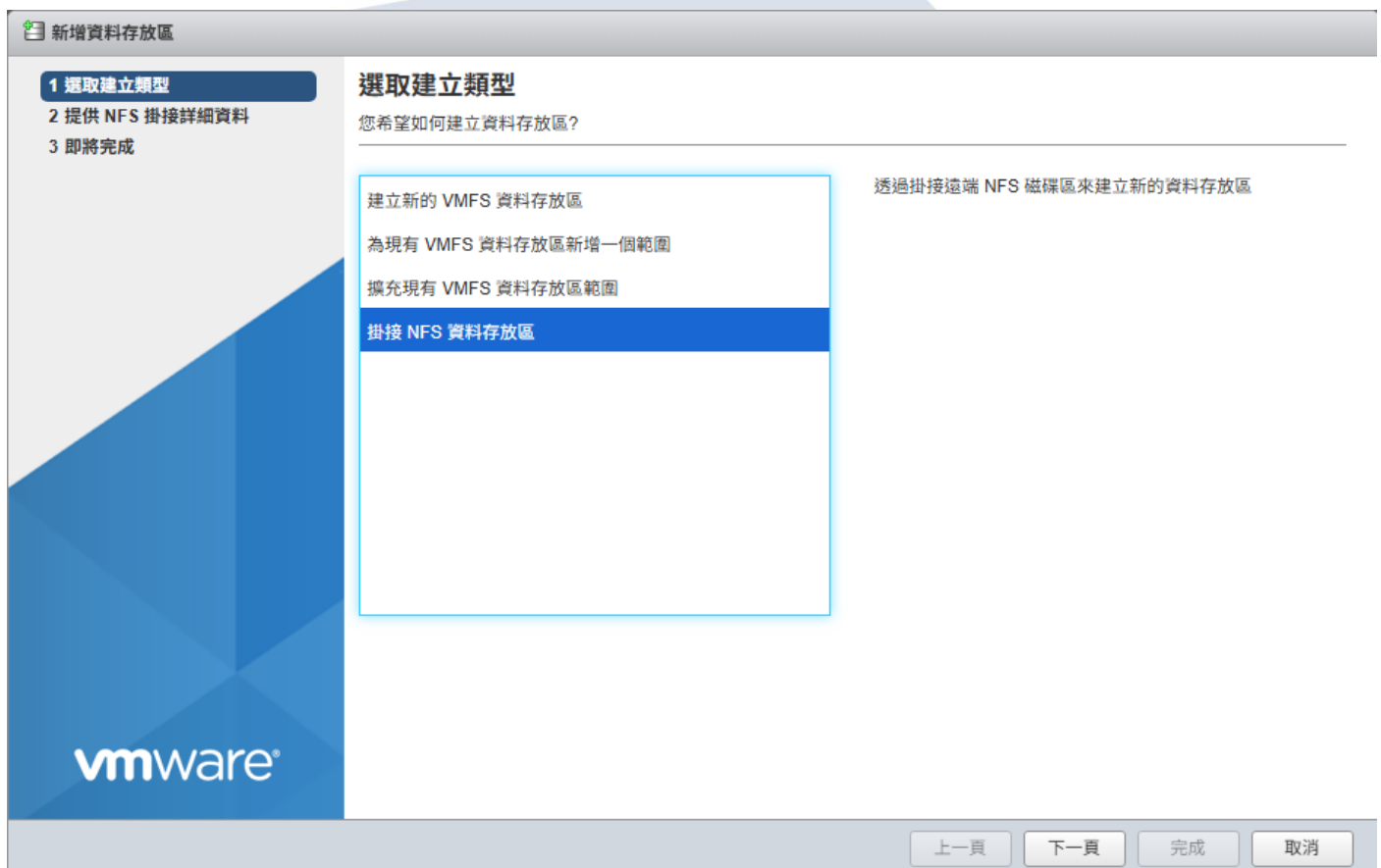
圖 2. 掛接 NFS 資料存放區