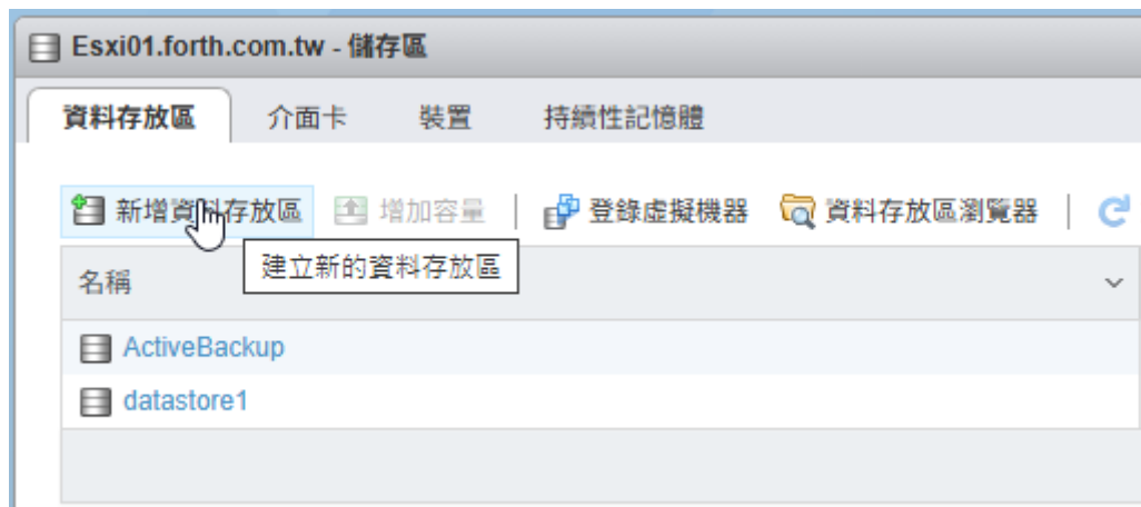
圖 1. ESXI 資料存放區